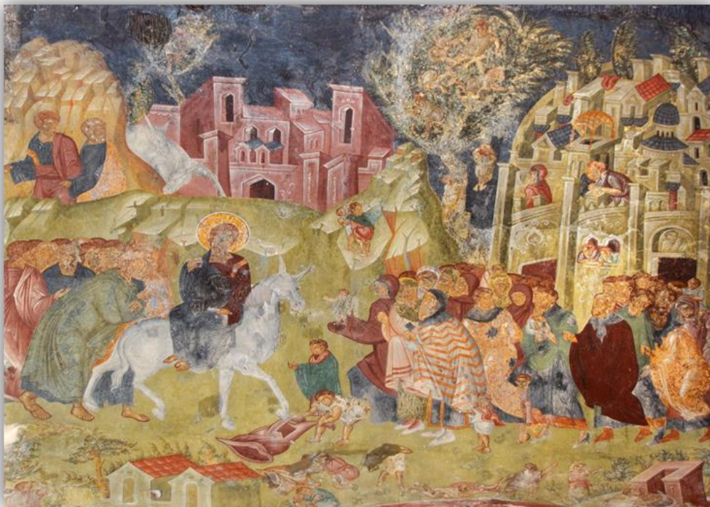
Εικόνα 16: «Βαϊοφόρος, εκκλησία Παντάνασσας, Μυστράς, 1445(φωτ. Γκλέκας, 1.2019)

και την υμνολογία. 23 Οι τοιχογραφίες της Παντάνασσας αποπνέουν ζωγραφικά τη φρεσκάδα της άνοιξης, αφού υπάρχει χρωματική ευφορία, ζωντανά χρώματα στα τοπία, έντονα χρωματισμένα αρχιτεκτονήματα και ενδύματα στις μορφές. Τέτοιου είδους χαρακτηριστικά συγκεντρώνει η τοιχογραφία που απεικονίζει την «Βαϊοφόρο», όπου ο Ιησούς Χριστός καθισμένος σε λευκό γαϊδουράκι, επευφημείται από τους κατοίκους της πόλης. Η σκηνή γίνεται ιδιαίτερα χαρούμενη από την παρουσία των πολλών παιδιών, που βρίσκονται σε μικρότερη κλίμακα εμπρός από τον Ιησού, αλλά ακόμα και πάνω στο δέντρο. 24