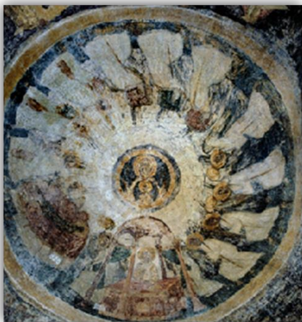
Εικόνα 20: «Θεοτόκος Δεομένη, ναός Αγίας Σοφίας Μυστράς, β' μισό 14 ου αι.

μόνο διακοσμητική, αλλά φέρει την επιγραφή «ΤΟ ΣΤΕΡΕΩΜΑ ΤΩΝ ΕΠΙ ΣΟΙ ΠΕΠΟΙΘΟΤΩΝ ΣΤΕΡΕΩΣΟΝ ΚΥΡΙΕ ΤΗΝ ΕΚΚΛΗΣΙΑΝ ΗΝ ΕΚΤΙΣΩ ΤΩ ΤΙΜΙΩ ΣΟΥ ΑΙΜΑΤΙ».