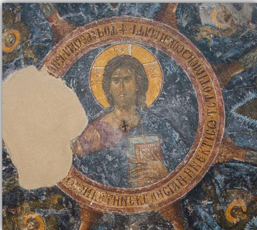
Εικόνα 19 «Ο Χριστός Παντοκράτωρ» Μυστράς, Περιβλεπτος γ' τέταρτο 14ου αι (φωτ. Γκλέκας, Ι. 2019)

μόνο διακοσμητική, αλλά φέρει την επιγραφή «ΤΟ ΣΤΕΡΕΩΜΑ ΤΩΝ ΕΠΙ ΣΟΙ ΠΕΠΟΙΘΟΤΩΝ ΣΤΕΡΕΩΣΟΝ ΚΥΡΙΕ ΤΗΝ ΕΚΚΛΗΣΙΑΝ ΗΝ ΕΚΤΙΣΩ ΤΩ ΤΙΜΙΩ ΣΟΥ ΑΙΜΑΤΙ».