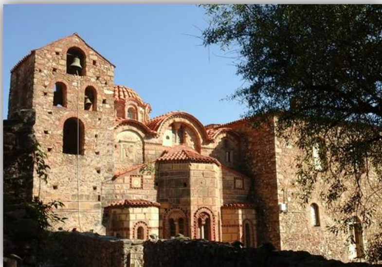
Εικόνα 2: Άγιος Δημήτριος Μυστράς 1270 μ.Χ. περίπου.