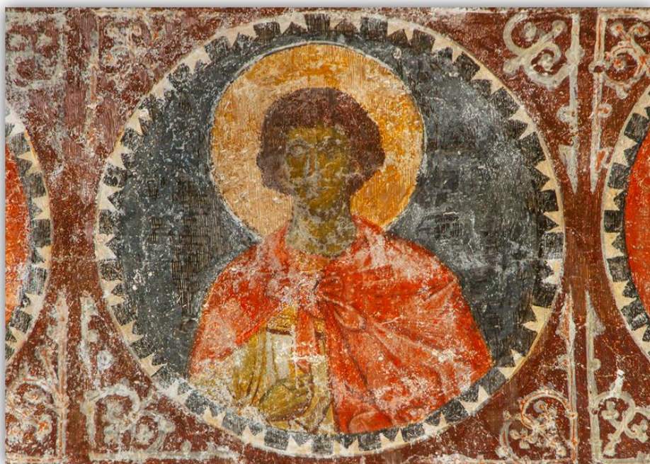
Εικόνα 18: Ζώνη στηθαίων αγίων και μαρτύρων, εκκλησία Αγίου Δημητρίου, Μυστράς, 1270-1285

Τεχνοτροπική εξέλιξη στα μετάλλια: Η απεικόνιση ιερών μορφών μέσα σε μετάλλια εμφανίζεται ήδη από τη Μεσοβυζαντινή περίοδο. Μέσα σε απλό, κυκλικό μετάλλιο απεικονίζεται ο Ιησούς ως βρέφος, στην αγκαλιά της Θεοτόκου, στον εικονογραφικό τύπο της Παναγίας της Βλαχερνίτισσας. Στην Παλαιολόγειο εικονογραφική περίοδο στον Μυστρά η αγιογράφηση μέσα σε μετάλλια υιοθετείται και εξελίσσεται τεχνοτροπικά. Ενδεικτικά, στον Άγιο Δημήτριο του Μυστρά, παρουσιάζεται ζώνη Αγίων και Μαρτύρων σε προτομές, που περικλείονται σε κυκλικά μετάλλια, εγγεγραμμένα σε τετράγωνα πλαίσια, που φέρουν λευκό, φυτικό διάκοσμο. Στον τρούλο της Περιβλέπτου του Μυστρά απεικονίζεται σε μετάλλιο ο «Παντοκράτορας» με ιδιαίτερο χαρακτηριστικό ότι η ταινία του μεταλλίου δεν είναι