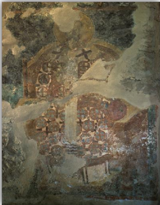
Εικόνα 21: «Ο Άγιος Ιωάννης ο Χρυσόστομος, παρεκκλήσι Αγίου Χριστοφόρου, Μυστράς, τέλη 14 ου αι.

Άγιο Μανδήλιο: Το Άγιο Μανδήλιο ανήκει στις χειροποίητες εικόνες και σύμφωνα με την Ιερά Παράδοση η μορφή του Ιησού Χριστού αποτυπώθηκε πάνω στο μαντήλι της Αγίας Βερονίκης, όταν εκείνη σκούπισε το ματωμένο Του πρόσωπο στην πορεία Του προς τον Γολγοθά. Ως θέμα αγιογραφίας εισάγεται τον 11 ο αιώνα 25 . Στην Παλαιολόγεια τέχνη διακρίνονται δύο εικονογραφικοί τύποι. Ο πρώτος και προγενέστερος απεικονίζει το Άγιο Μανδήλιο ως λευκό, τεντωμένο ύφασμα, ακολουθώντας την παλιά παράδοση σύμφωνα με την οποία το Μανδήλιο ήταν καρφωμένο σε σανίδα. Τύπος τέτοιου Μανδηλίου είναι εικονογραφημένο στην Παντάνασσα.