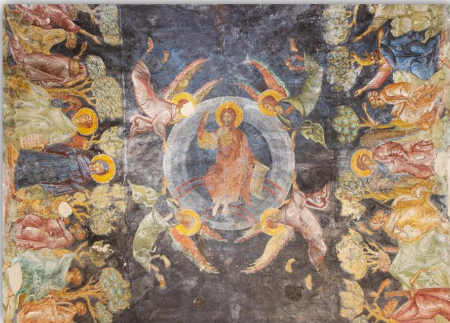
Εικόνα 1: Η Ανάληψη, εκκλησία Παντάνασσας, Μυστράς 15 ος αιώνας.