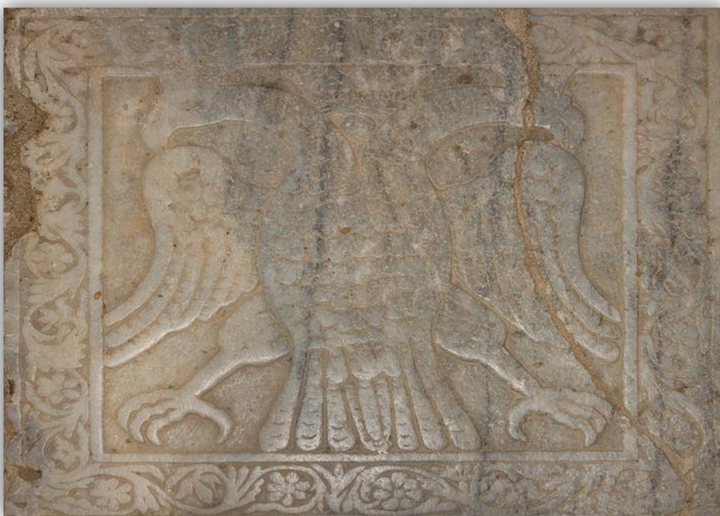
Εικόνα 30: «Επιδαπέδιος, μαρμάρινος Δικέφαλος Αετός» Μυστράς, Άγιος Δημήτριος, 1270-1287

Τα σταυρόλεξα έχουν δημιουργηθεί με το ελεύθερο λογισμικό «crossword labs». Η δραστηριότητα αποβλέπει στην εξοικείωση των μαθητών με τη γλώσσα της αγιογραφίας και της Ελληνορθόδοξης Παράδοσης. Στόχος είναι ο εμπλουτισμός του λεξιλογίου τους και η καταγραφή των νέων λέξεων.