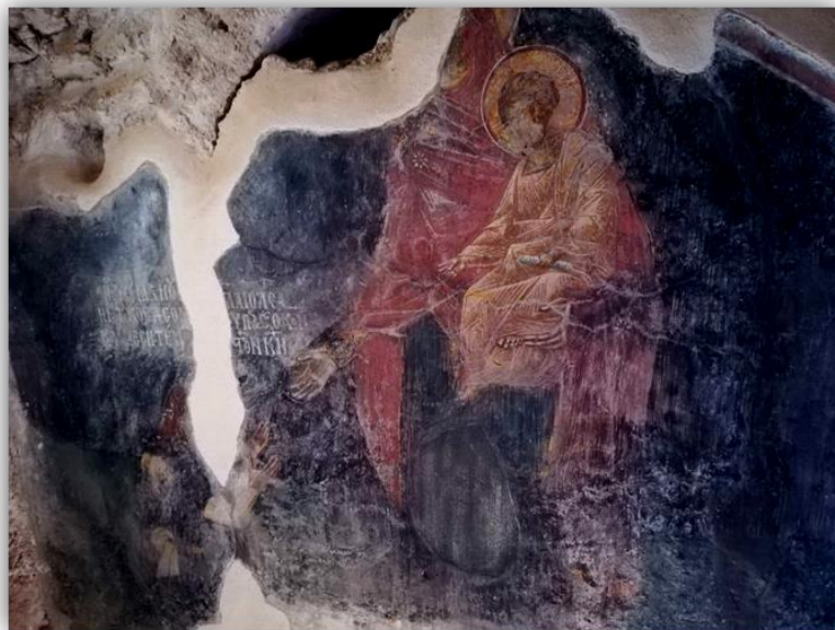
Εικόνα 25: Ταφικό πορτρέτο ενός Μανουήλ Παλαιολόγου, παρεκκλήσιο Αγίων Θεοδώρων, Μυστράς 1423 ή 1453

Η μορφή εικονίζεται σε στάση δέησης, εμπρός από τη Θεοτόκο που κρατά στην αγκαλιά της τον μικρό Χριστό. Από την ενδυμασία των απεικονιζόμενων μορφών πληροφορούμαστε για την κοινωνική τάξη και καταγωγή των κεκοιμημένων. Ο Μανουήλ Παλαιολόγος φορά σκουρόχρωμο, εξωτερικό χιτώνα, που συγκρατείται στη μέση με πολυτελή ζώνη. Το λευκό μαντήλι, που είναι δεμένο στη ζώνη, φανερώνει την αριστοκρατική του καταγωγή. Μέσα από τον χιτώνα φορά λευκό υποκάμισο, με εφαρμοστά μανίκια που κλείνουν στον καρπό με τέσσερα κουμπιά. Ο τύπος αυτός ενδυμασίας ήταν ιδιαίτερα διαδεδομένος στα χρόνια των Παλαιολόγων. Επίσης, στην Οδηγήτρια του Μυστρά, στην επιφάνεια της εσοχής του αρκοσολίου υπάρχει ζεύγος ικετών που ανάγεται χρονολογικά στο α' τέταρτο του 14 ου αιώνα. Οι μορφές των ικετών εικονίζονται σε στάση δέησης, εκατέρωθεν της Θεοτόκου που κρατά στην αγκαλιά της τον μικρό Χριστό.