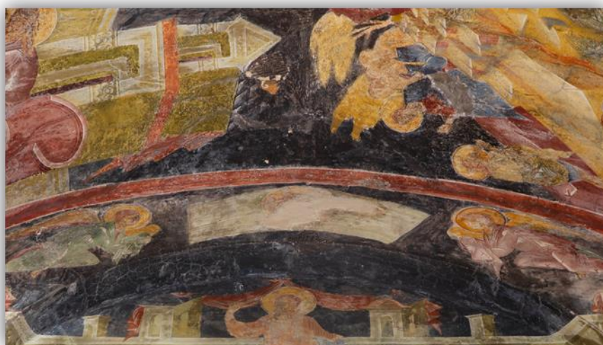
Εικόνα 22: «Άγιο Μανδήλιο», Μυστράς, Παντάνασσα, 15ος αι. (φωτ. Γκλέκας, Ι. 2019)

Άγιο Μανδήλιο: Το Άγιο Μανδήλιο ανήκει στις χειροποίητες εικόνες και σύμφωνα με την Ιερά Παράδοση η μορφή του Ιησού Χριστού αποτυπώθηκε πάνω στο μαντήλι της Αγίας Βερονίκης, όταν εκείνη σκούπισε το ματωμένο Του πρόσωπο στην πορεία Του προς τον Γολγοθά. Ως θέμα αγιογραφίας εισάγεται τον 11 ο αιώνα 25 . Στην Παλαιολόγεια τέχνη διακρίνονται δύο εικονογραφικοί τύποι. Ο πρώτος και προγενέστερος απεικονίζει το Άγιο Μανδήλιο ως λευκό, τεντωμένο ύφασμα, ακολουθώντας την παλιά παράδοση σύμφωνα με την οποία το Μανδήλιο ήταν καρφωμένο σε σανίδα. Τύπος τέτοιου Μανδηλίου είναι εικονογραφημένο στην Παντάνασσα.