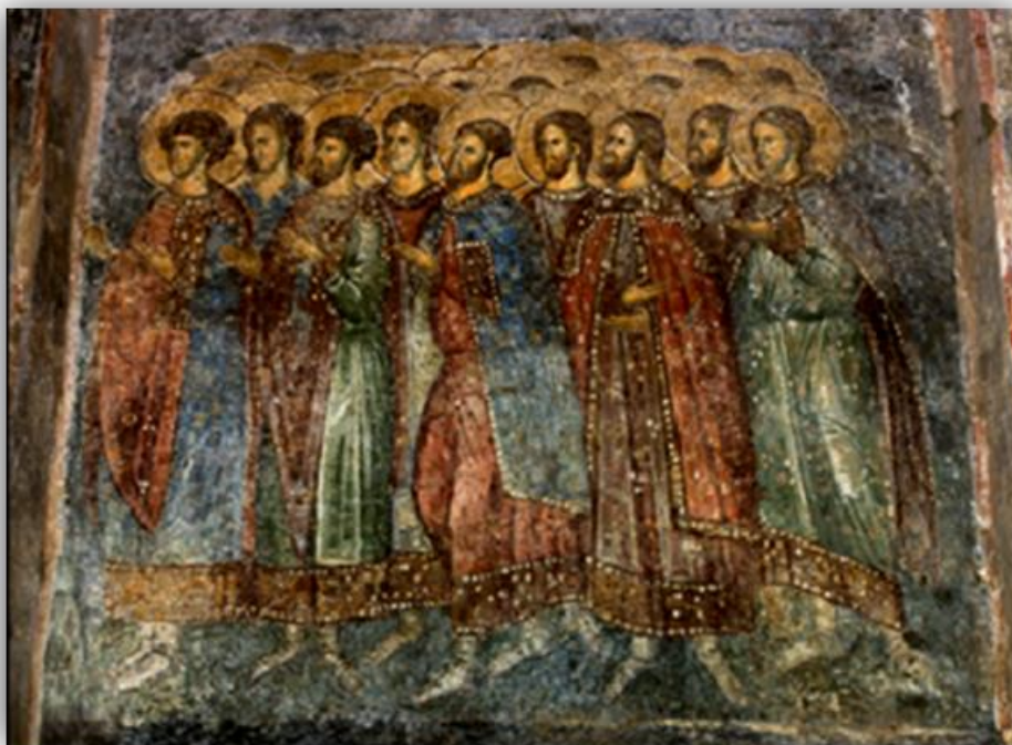
Εικόνα 9: «Ο Χορός των Αγίων» Μυστράς Οδηγήτρια, α' τέταρτο του 14 ου αι.» (φωτ. από Μυστράς DVD, 2008)

Το πλάσιμο είναι γλυπτικό και τα φωτίσματα πλατιά. Χαρακτηριστικό παράδειγμα είναι «Ο χορός των Αγίων» στον ναό της Οδηγήτριας του Μυστρά. Είναι αριστουργηματικό έργο, που συγκεντρώνει αρκετά αρχαϊκά στοιχεία. Η αγιογραφία είναι εμπνευσμένη από τη φράση «Μετά πνευμάτων δικαίων τετελειωμένων» και για