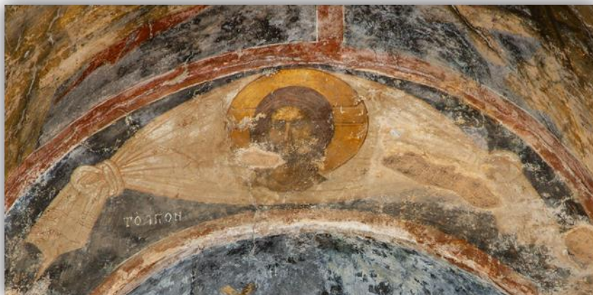
Εικόνα 23: «Άγιο Μανδήλιο», Μυστράς, Περίβλεπτος, γ' τέταρτο 14ου αι.

Ο δεύτερος εικονογραφικός τύπος αναπαριστά το Άγιο Μανδήλιο, δεμένο στις άκρες με κόμπους. Έτσι, το Μανδήλιο στο κέντρο παίρνει σχήμα ωοειδές, με τις δυο του άκρες να κρέμονται προς τα κάτω 26 .