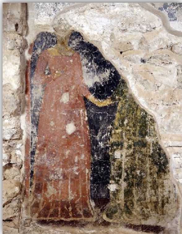
Εικόνα 27: Ταφικό πορτρέτο του σκουτερίου Κανιώτη και της συζύγου του, Ναός Οδηγήτριας, Μυστράς 14 ος - 15 ος αι. (φωτ. από Μυστράς DVD, 2008)

Η ενδυμασία των απεικονιζόμενων μορφών φανερώνει και εδώ την κοινωνική τάξη και καταγωγή των κεκοιμημένων. Ο ικέτης φορά πολυτελές ένδυμα με φυτικό διάκοσμο. Το χαρακτηριστικό μαντίλι που είναι δεμένο στη μέση του φανερώνει την ευγενική του καταγωγή. Η ικέτισσα φορά ερυθρόμορφο ένδυμα που φέρει χρυσοκεντητική και στο κεφάλι έχει υφασμάτινο κάλυμμα. Επίσης, στο νότιο παρεκκλήσιο της Οδηγήτριας, ιδιαίτερο ενδυματολογικό ενδιαφέρον παρουσιάζει απεικονιζόμενο ζεύγος αριστοκρατών. Ο άνδρας φορά πολυτελές χρυσοκέντητο, μακρύ ένδυμα, που φέρει φυτικό διάκοσμο. Η σύζυγός του φορά κομψό, μακρύ, πορφυρό ένδυμα, διακοσμημένο με χρυσές ταινίες. Τα μανίκια είναι στενά και στους ώμους πέφτει ελεύθερα πιθανόν μαντίλι, το οποίο συνηθιζόταν από τις γυναίκες την εποχή εκείνη. 28 Στον ναό της Οδηγήτριας στον Μυστρά, στο νότιο παρεκκλήσιο, παριστάνεται στο αρκοςόλιο η πολυπρόσωπη σύνθεση της Κοίμησης της Θεοτόκου.