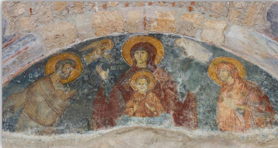
Εικόνα 7: «Η Θεοτόκος ως Ζωοδόχος πηγή», Οδηγήτρια, Μυστράς α' τέταρτο του 14 ου αι. (φωτ. Γκλέκας, Ι. 2019)