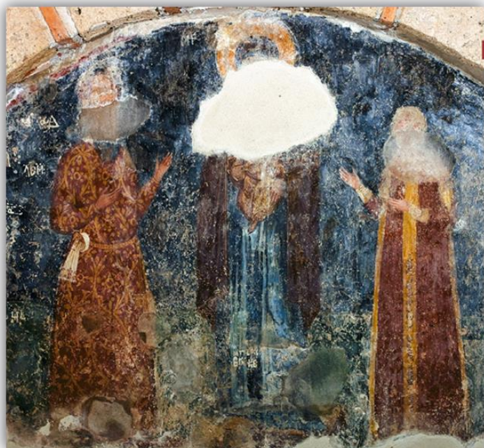
Εικόνα 26: «Ζεύγος ικετών», Μυστράς, Οδηγήτρια, α' τέταρτο 14ου αι.

Η μορφή εικονίζεται σε στάση δέησης, εμπρός από τη Θεοτόκο που κρατά στην αγκαλιά της τον μικρό Χριστό. Από την ενδυμασία των απεικονιζόμενων μορφών πληροφορούμαστε για την κοινωνική τάξη και καταγωγή των κεκοιμημένων. Ο Μανουήλ Παλαιολόγος φορά σκουρόχρωμο, εξωτερικό χιτώνα, που συγκρατείται στη μέση με πολυτελή ζώνη. Το λευκό μαντήλι, που είναι δεμένο στη ζώνη, φανερώνει την αριστοκρατική του καταγωγή. Μέσα από τον χιτώνα φορά λευκό υποκάμισο, με εφαρμοστά μανίκια που κλείνουν στον καρπό με τέσσερα κουμπιά. Ο τύπος αυτός ενδυμασίας ήταν ιδιαίτερα διαδεδομένος στα χρόνια των Παλαιολόγων. Επίσης, στην Οδηγήτρια του Μυστρά, στην επιφάνεια της εσοχής του αρκοσολίου υπάρχει ζεύγος ικετών που ανάγεται χρονολογικά στο α' τέταρτο του 14 ου αιώνα. Οι μορφές των ικετών εικονίζονται σε στάση δέησης, εκατέρωθεν της Θεοτόκου που κρατά στην αγκαλιά της τον μικρό Χριστό.