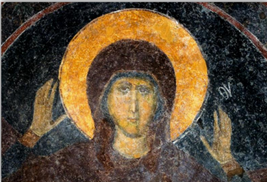
Εικόνα 8: «Η Παρθένοσ και το Βρέφος» Μυστράς, Οδηγήτρια, α' τέταρτο 14 ου αιώνα