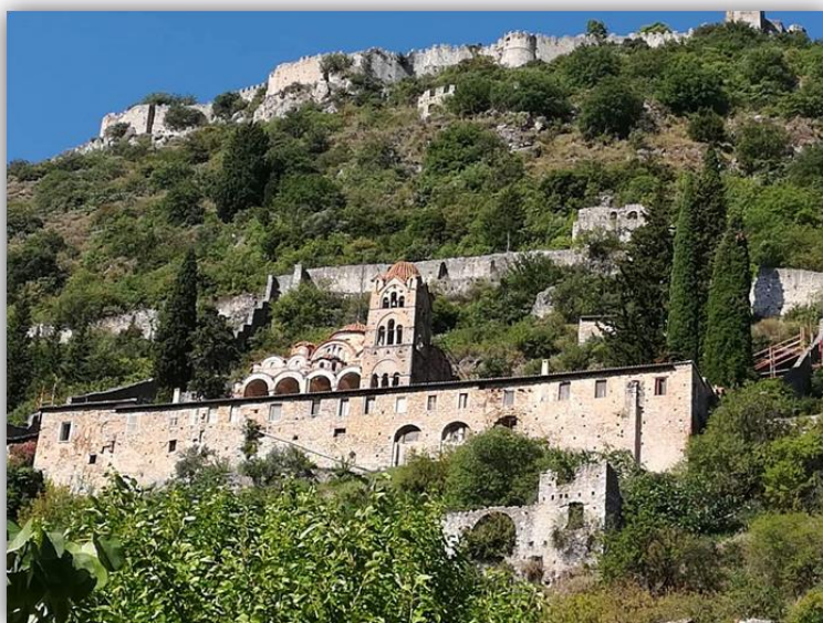
Εικόνα 14: Το καθολικό της Μονής της Παντάνασσας, Μυστράς 15 ος αι.