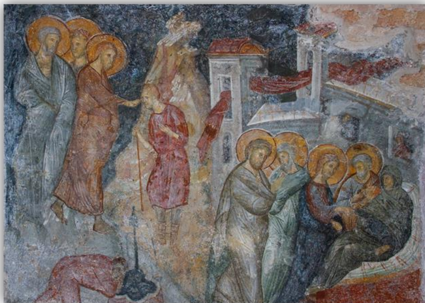
Εικόνα 5: « Ηίαση του εκ γενετής τυφλού » & « Ηίαση της πεθεράς του Πέτρου », ναός Οδηγήτριας, Μυστράς, α' τέταρτο 14 ου αι. (φωτ. Γκλέκας, Ι. 2019)

Η Οδηγήτρια ή Αφεντικό κτίστηκε στις αρχές του 14 ου αιώνα ως το νέο καθολικό της μονής του Βροντοχίου. Ο ναός είναι επιβλητικό κτίριο με τοξωτές αψίδες, πολλά κλίτη και πυργόσχημα παρεκκλήσια. Στον ναό αυτό εντοπίζονται αρχαϊκά στοιχεία. Υπάρχει μια αναβίωση και ζωγραφική απόδοση της «κλασικής τάσης» που αντλείται από εικονογραφημένα χειρόγραφα, που μεταφέρουν και αντιγράφουν, παλιότερα μοτίβα της ζωγραφικής Αρχαιότητας. Οι τοιχογραφίες είναι πολυπρόσωπες και διακρίνονται για την κομψότητα και την αέρινη κίνηση των μορφών, καθώς επίσης και τον πλούτο των χρωμάτων. Η θεματολογία εμπλουτίζεται και οι μορφές αποκτούν χάρη, κομψότητα και διαπνέονται από μία αίσθηση αέρινης και ρυθμικής κίνησης 18 . Το σχήμα των ματιών είναι αυγόσχημο και το βλέμμα εκφραστικό και τρυφερό. Υπάρχει χαρακτηριστική τριγωνική σκιά ανάμεσα στα φρύδια και καλογραμμένα βλέφαρα. Η μύτη κοντυλένια και το στόμα μικρό και καλοσχεδιασμένο.