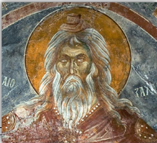
Εικόνα 6: « Οιεράρχης Ζαχαρίας » Οδηγήτρια, Μυστράς, α' τέταρτο 14 ου .

Η Οδηγήτρια ή Αφεντικό κτίστηκε στις αρχές του 14 ου αιώνα ως το νέο καθολικό της μονής του Βροντοχίου. Ο ναός είναι επιβλητικό κτίριο με τοξωτές αψίδες, πολλά κλίτη και πυργόσχημα παρεκκλήσια. Στον ναό αυτό εντοπίζονται αρχαϊκά στοιχεία. Υπάρχει μια αναβίωση και ζωγραφική απόδοση της «κλασικής τάσης» που αντλείται από εικονογραφημένα χειρόγραφα, που μεταφέρουν και αντιγράφουν, παλιότερα μοτίβα της ζωγραφικής Αρχαιότητας. Οι τοιχογραφίες είναι πολυπρόσωπες και διακρίνονται για την κομψότητα και την αέρινη κίνηση των μορφών, καθώς επίσης και τον πλούτο των χρωμάτων. Η θεματολογία εμπλουτίζεται και οι μορφές αποκτούν χάρη, κομψότητα και διαπνέονται από μία αίσθηση αέρινης και ρυθμικής κίνησης 18 . Το σχήμα των ματιών είναι αυγόσχημο και το βλέμμα εκφραστικό και τρυφερό. Υπάρχει χαρακτηριστική τριγωνική σκιά ανάμεσα στα φρύδια και καλογραμμένα βλέφαρα. Η μύτη κοντυλένια και το στόμα μικρό και καλοσχεδιασμένο.