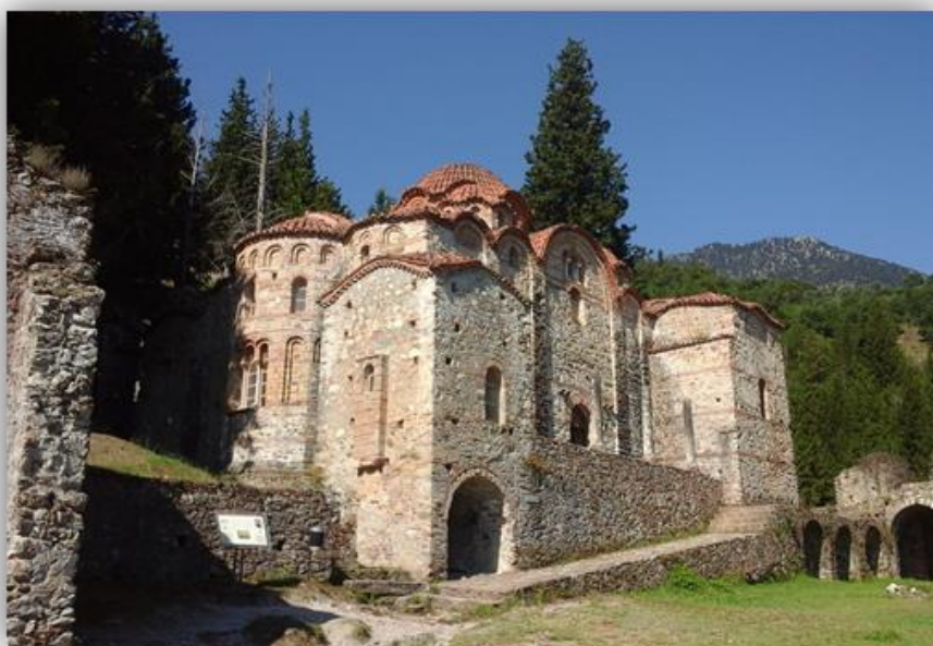
Εικόνα 4: Οδηγήτρια ή Αφεντικό- Μυστράς 1310

Επιπλέον, η τεχνική της «Βυζαντινής ανάστροφης προοπτικής» που εντοπίζεται χαρακτηριστικά, στην «Ετοιμασία του Θρόνου», πάνω από το διακονικό στην εκκλησία του Αγίου Δημητρίου, παρουσιάζει γραμμές που δεν συγκλίνουν σε ένα σημείο φυγής πίσω από την ζωγραφική παράσταση, αλλά συγκλίνουν ανάστροφα προς τον θεατή, ώστε με τον τρόπο αυτό να επιτυγχάνεται η αίσθηση της προσωπικής, ζωντανής σχέσης του πιστού με την υπόσταση του Θεού και των Αγίων. Αλλάζουν οι φυσικές αναλογίες, μεγαθύνεται ό,τι είναι σπουδαιότερο και έτσι επιτυγχάνεται μια οπτική εσωτερική τάξη που προβάλλει τις πνευματικές αξίες.