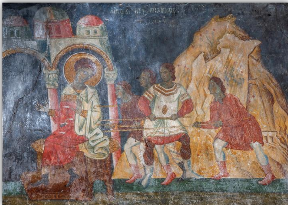
Εικόνα 3: «Το μαρτύριο του Αγίου Δημητρίου» Μυστράς, Άγιος Δημήτριος, 1270-1287

Επιπλέον, η τεχνική της «Βυζαντινής ανάστροφης προοπτικής» που εντοπίζεται χαρακτηριστικά, στην «Ετοιμασία του Θρόνου», πάνω από το διακονικό στην εκκλησία του Αγίου Δημητρίου, παρουσιάζει γραμμές που δεν συγκλίνουν σε ένα σημείο φυγής πίσω από την ζωγραφική παράσταση, αλλά συγκλίνουν ανάστροφα προς τον θεατή, ώστε με τον τρόπο αυτό να επιτυγχάνεται η αίσθηση της προσωπικής, ζωντανής σχέσης του πιστού με την υπόσταση του Θεού και των Αγίων. Αλλάζουν οι φυσικές αναλογίες, μεγαθύνεται ό,τι είναι σπουδαιότερο και έτσι επιτυγχάνεται μια οπτική εσωτερική τάξη που προβάλλει τις πνευματικές αξίες.