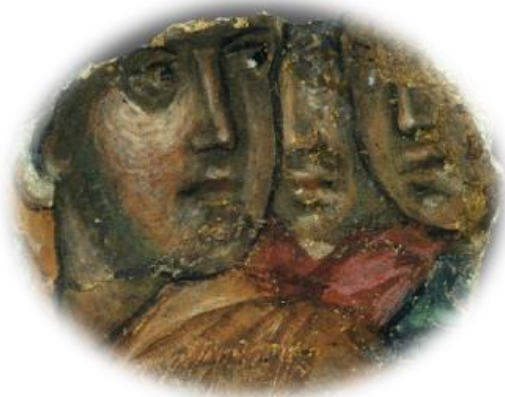
Εικόνα 17: «Όμιλος τριών νεανικών μορφών», Μυστράς, παρεκκλήσι Αγίου Χριστοφόρου, δ΄ τέταρτο 14ου αι.

Τεχνοτροπική εξέλιξη στα μετάλλια: Η απεικόνιση ιερών μορφών μέσα σε μετάλλια εμφανίζεται ήδη από τη Μεσοβυζαντινή περίοδο. Μέσα σε απλό, κυκλικό μετάλλιο απεικονίζεται ο Ιησούς ως βρέφος, στην αγκαλιά της Θεοτόκου, στον εικονογραφικό τύπο της Παναγίας της Βλαχερνίτισσας. Στην Παλαιολόγειο εικονογραφική περίοδο στον Μυστρά η αγιογράφηση μέσα σε μετάλλια υιοθετείται και εξελίσσεται τεχνοτροπικά. Ενδεικτικά, στον Άγιο Δημήτριο του Μυστρά, παρουσιάζεται ζώνη Αγίων και Μαρτύρων σε προτομές, που περικλείονται σε κυκλικά μετάλλια, εγγεγραμμένα σε τετράγωνα πλαίσια, που φέρουν λευκό, φυτικό διάκοσμο. Στον τρούλο της Περιβλέπτου του Μυστρά απεικονίζεται σε μετάλλιο ο «Παντοκράτορας» με ιδιαίτερο χαρακτηριστικό ότι η ταινία του μεταλλίου δεν είναι