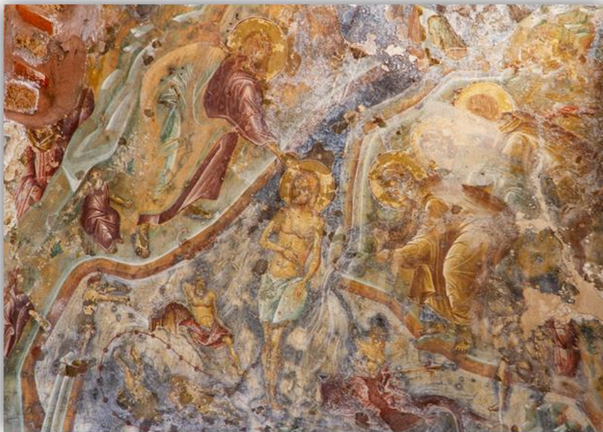
Εικόνα 13: «Η Βάπτιση» εκκλησία Οδηγήτριας, Μυστράς α' τέταρτο 14 ου αι.

Το μοναστήρι της Παντάνασσας ανήκει στον 15 ο αι και εγκαινιάστηκε το 1428. Σύμφωνα με τα μονογράμματα και τις επιγραφές, ιδρυτής είναι ο Ιωάννης Φραγκόπουλος. Το καθολικό της Μονής της Παντάνασσας, έχει σπάνιο αρχιτεκτονικό τύπο που ονομάζεται «μικτός» ή «τύπος του Μυστρά». Τρίκλιτη Βασιλική με κιονοστοιχίες από τρεις κίονες στη βάση και πεντάτρουλος σταυροειδής