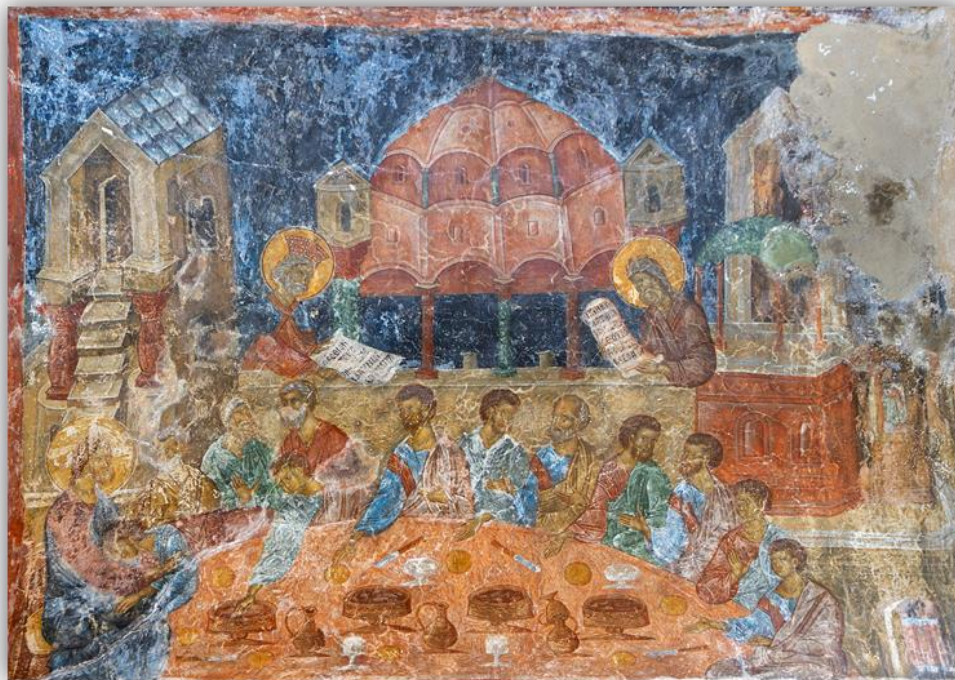
Εικόνα 11: «Ο Μυστικός Δείπνος», Μυστράς, Περίβλεπτος, γ' τέταρτο του 14 ου αι.

τέλη 14 ου αιώνα