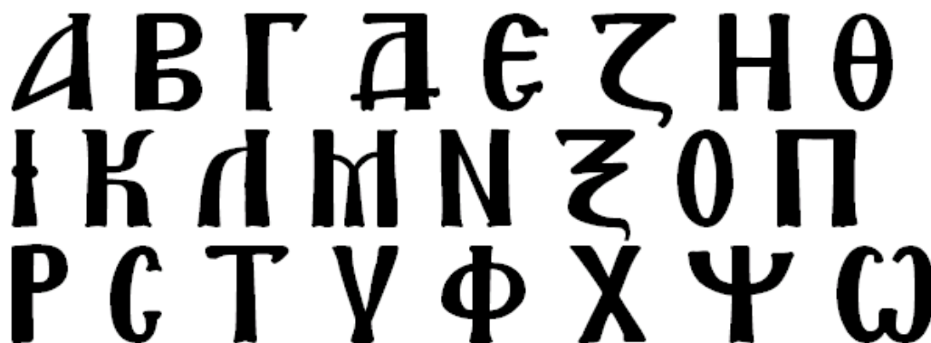
Εικόνα 29: Βράνου, Ιωάννου Χ. 2001

Πρόκειται για δραστηριότητα, όπου οι μαθητές θα δημιουργήσουν επιγραφές στην βυζαντινή γραφή. Οι μαθητές, εστιάζουν την προσοχή τους σε διάφορα εικονιζόμενα ειλητάρια. Ο υπεύθυνος του προγράμματος διαβάζει και εξηγεί ενδεικτικά δυο – τρία ειλητάρια και ενημερώνει τα παιδιά ότι πάνω σε κάθε ειλητάριο είναι γραμμένα κάποια χαρακτηριστικά λόγια του κάθε αγίου. Κατόπιν, μοιράζουμε στις ομάδες χαρτί Α4 πάνω στο οποίο είναι τυπωμένο το κεφαλαιογράμματο βυζαντινό Αλφάβητο. Πάνω σε χαρτονάκια υπάρχουν επιγραφές είτε από τις τοιχογραφίες των ναών του Μυστρά, είτε χαρακτηριστικές επιγραφές όπως: «ΝΙΨΟΝ ΑΝΟΜΗΜΑΤΑ ΜΗ ΜΟΝΑΝ ΟΨΙΝ», «ΑΓΑΠΑΤΕ ΑΛΛΗΛΟΥΣ», «ΜΕΘ’ ΗΜΩΝ Ο ΘΕΟΣ», «ΦΩΣ ΧΡΙΣΤΟΥ ΦΑΙΝΕΙ ΠΑΣΙ» κ.α . Οι επιγραφές στα κερτελάκια είναι γραμμένες με το νεοελληνικό, κεφαλαιογράμματο αλφάβητο και οι μαθητές θα το αντιγράψουν στο δικό τους καρτελάκι με το αντίστοιχο βυζαντινό αλφάβητο. Στο σχολείο, μπορούν αν θέλουν, να κόψουν όλες τις επιγραφές και να τις κολλήσουν σε χαρτόνι και να το αναρτήσουν στην τάξη τους.