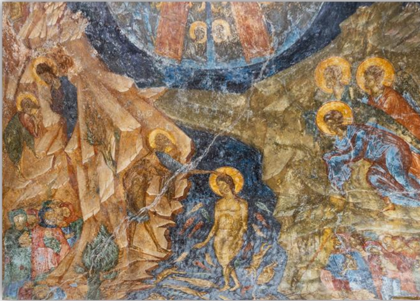
Εικόνα 12: «Η Βάπτιση του Ιησού» εκκλησία Περίβλεπτος, Μυστράς γ' τέταρτο 14 ου αι.